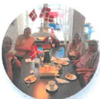
Engelse fejres af familie.