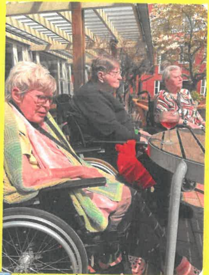
↑ Vejret var så godt her i slut april at vi alle kunne sætte os ud i haven og nyde forårssolen 🌸🌺