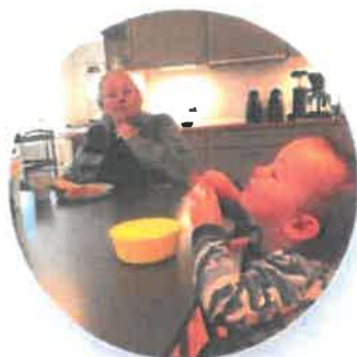
Karen og barn