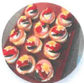
Flødekager til kaffen