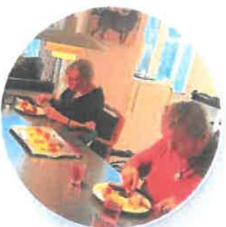
Vi spiser smørrebrød

HAR DU IDEER TIL UNDERHOLDNING? KONTAKT RAND 1