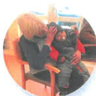
Lisbeth og barn