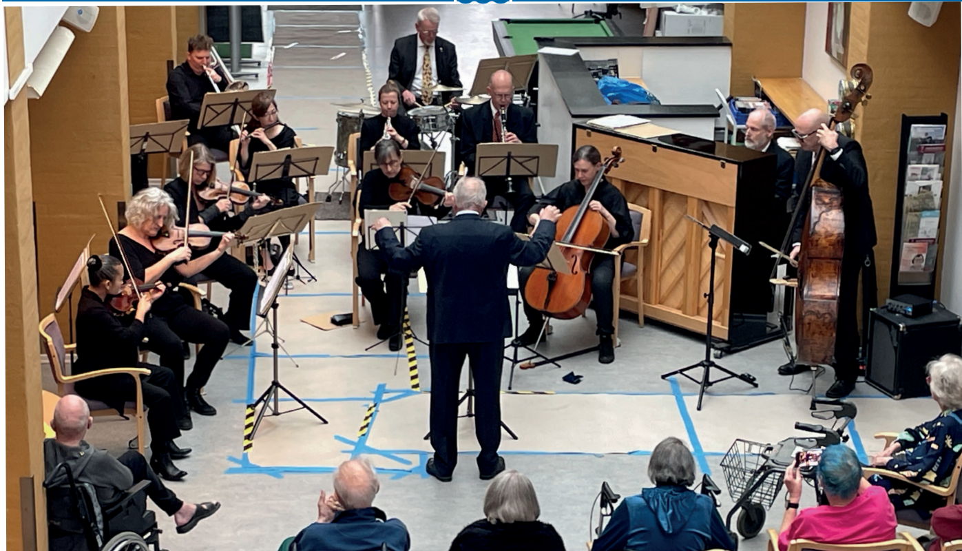
Promenadeorkestret består af