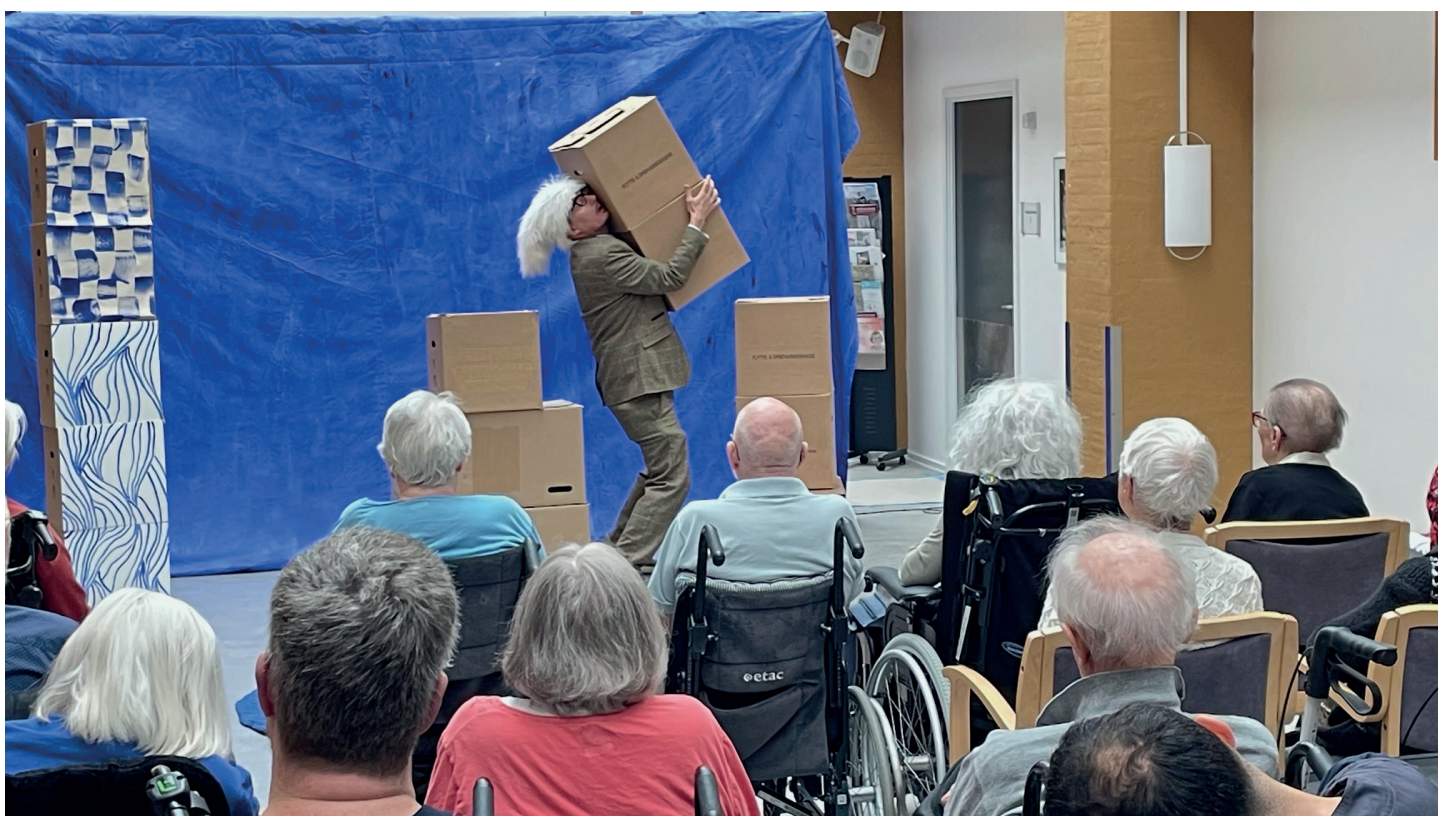
Teater Kriskat har optrådt for mere end 100 plejehjem.

Teater Kriskat har spillet på mere end 100 Plejehjem i Danmark. Gennem scenekunststudvalgets ”puljen til teater på pleje- og aktivitetscentre”, der uddeles til teateroplevelser til beboerne på Københavns Kommunes pleje- og aktivitetscentre, har vi i Nybodergården haft fornøjelsen af at opleve Teater Kriskat opføre stykket Genklang den 10. april. Genklang er et teaterstykke om en mand, som flytter ind på plejehjem, i vores tilfælde på Nybodergården. Her får beboerne mulighed for at opleve en mands tilgang til en ny situation i livet, en situation som potentielt kan vække genkendelse og fremkalde erindringer fra beboernes eget liv. Manden, som hedder Geo Hansen, kommer med sine flyttekasser. Han ser frem til at møde beboerne, naboer og dem, som arbejder på stedet. Han lever lidt i sine forskellige verdener/ virkeligheder. Han pakker flyttekasserne ud og finder bl.a. sin afdøde kones kjole, som han danser med. Kjolen bliver til sin elskede, fortiden bliver til nuet.