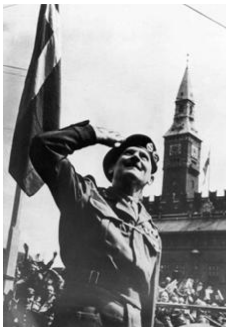
Montgomery hyldes af danskerne 12. maj 1945 på Rådhuspladsen i København.

havde klasse og var altid høflig og korrekt i sin optræden. Og nu kom så Montgomery. Han var heller ikke af imponerende statur, men han osede af pondus og autoritet.