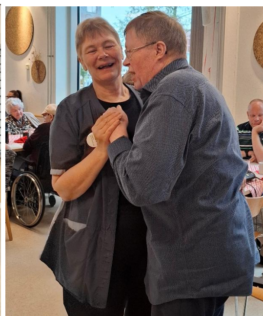
Flere dejlige billeder fra dagen med pølsevognen