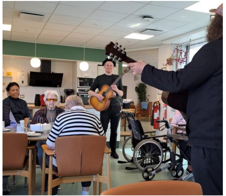
Så på afdeling B og endelig på afdeling A