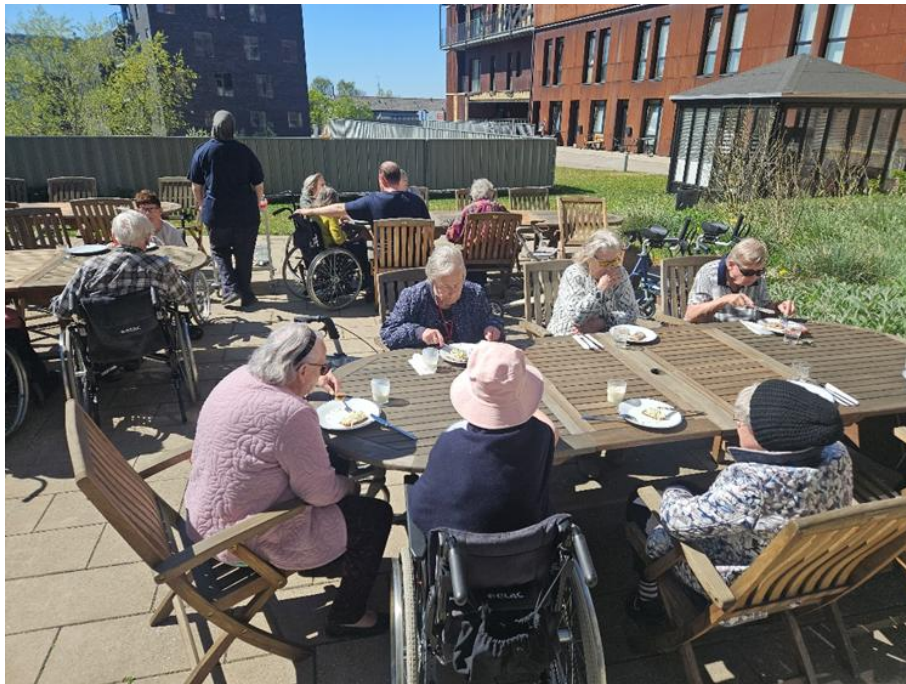
Afdeling A udnyttede det gode vejr og spiste frokost i haven den 2. maj

Endnu engang bekostede Københavns Kommune en eftermiddag med musik En halv times koncert i hver afdeling, det var så festligt